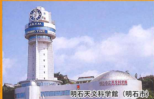
明石天文科学館 (明石市)