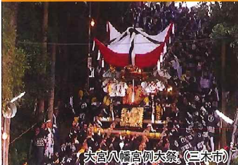
大宮八幡宮例大祭 (三木市)