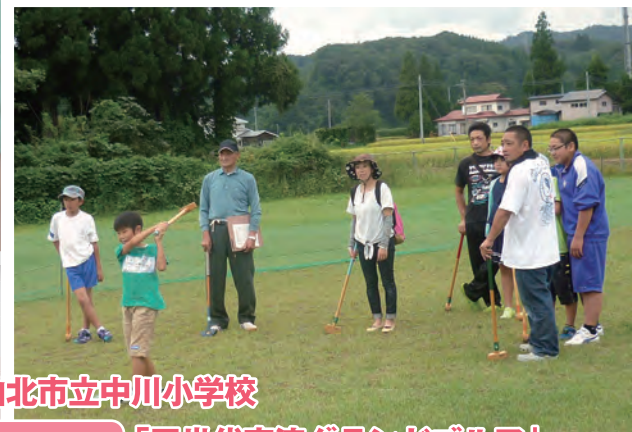
仙北市立中川小学校