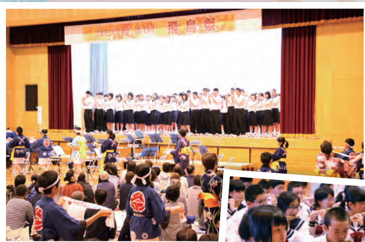
由利本荘市立鳥海中学校 小中合同学校祭「飛鳥祭」