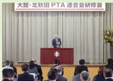
大館・北秋田 PTA 連合会研修会

10月14日(土)に大館市立第一中学校を会場として、「大館・北秋田PTA連合会研修会」を開催しました。各学校の学習発表会や地域行事等と重